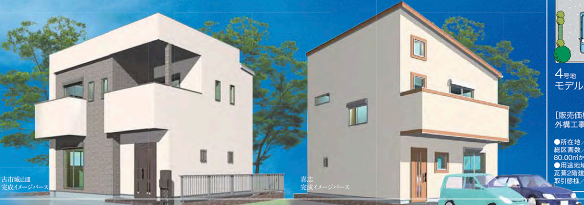
古市城山Ⅲ 完成イメージバス

人気の分譲地に待望の新モデルハウス登場。大黒ハウスの「家づくり」を体感してください。